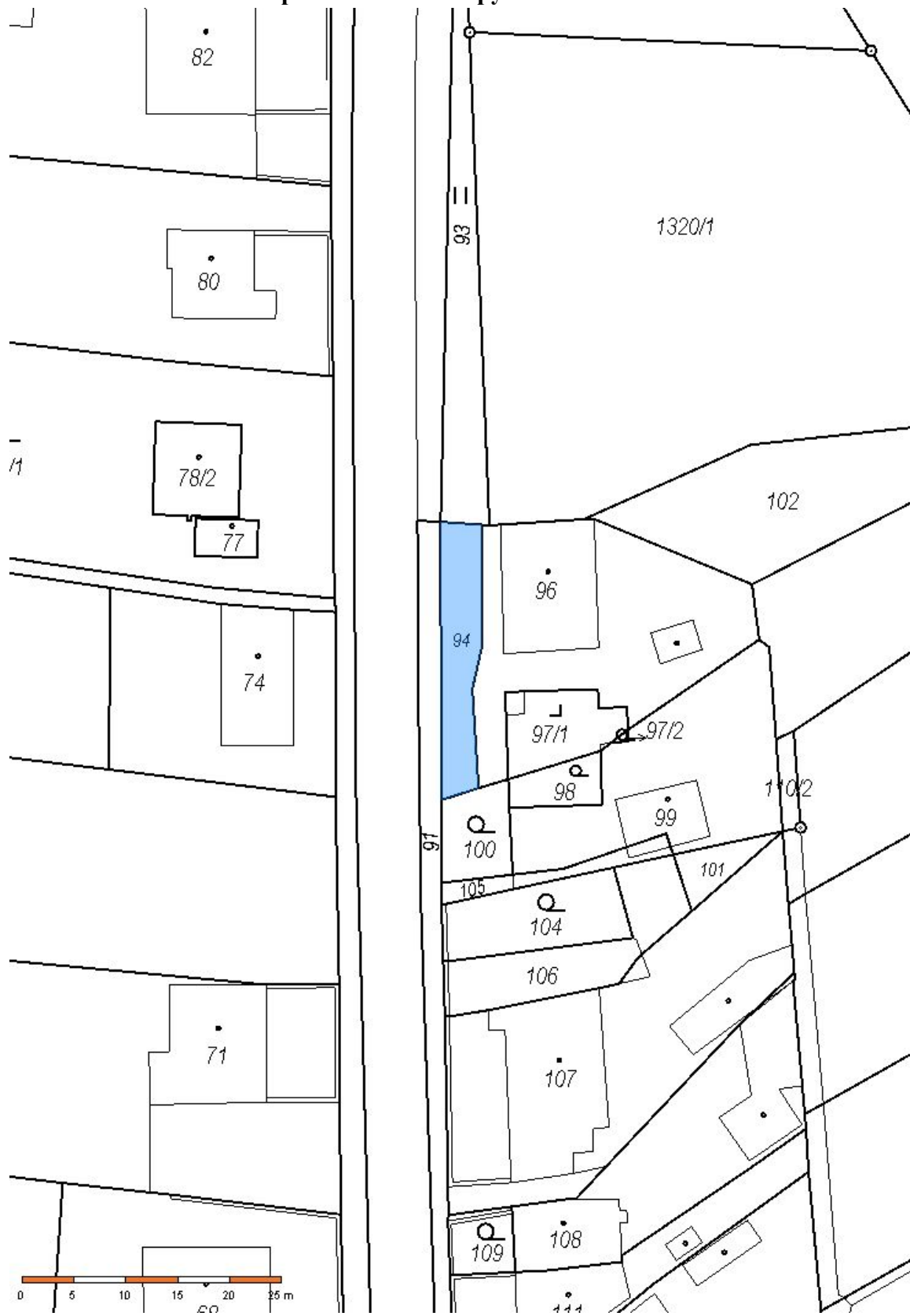
Pozemek p.č. 94 v k.ú. č. 673196