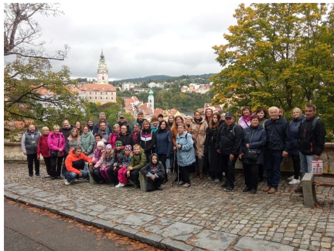
Zájezd do Českého Krumlova 2024

Všechny akce a jejich termíny jsou uvedené v obecním kalendáři na rok 2025 a před jejich pořádáním o nich informujeme na webových stránkách obce, na místní vývěsce i hlášením.