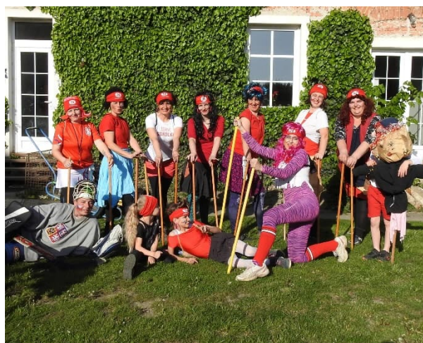
Podomské mistrovství čarodějnic 2024